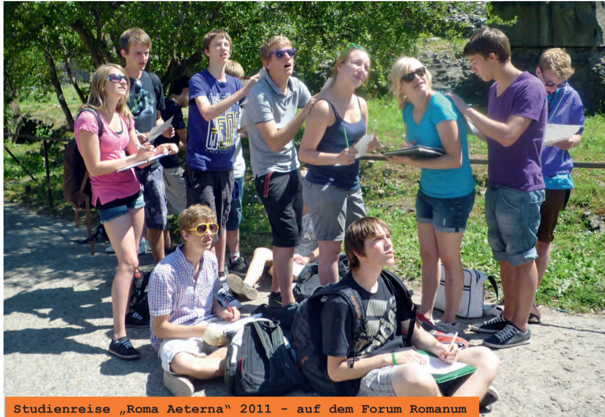
Studienreise „Roma Aeterna“ 2011 – auf dem Forum Romanum

Die Lehrpersonen unserer Kantonsschule und Fachmittelschule ermöglichen unseren Schülerinnen und Schülern während der Studienwochenzeit bei grösster Themenvielfalt beson-