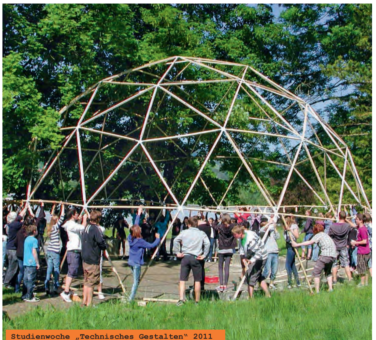
Studienwoche „Technisches Gestalten“ 2011